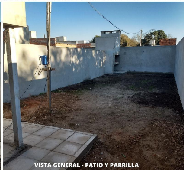
VISTA GENERAL - PATIO Y PARRILLA