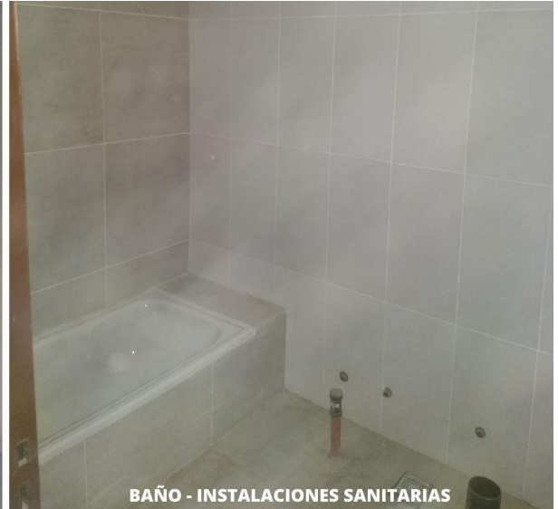
BAÑO - INSTALACIONES SANITARIAS