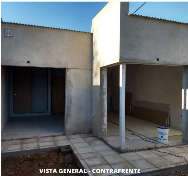
VISTA GENERAL - CONTRAFRENTE