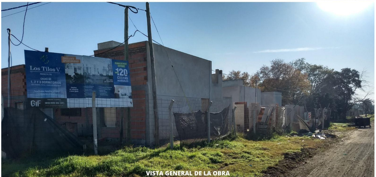
VISTA GENERAL DE LA OBRA