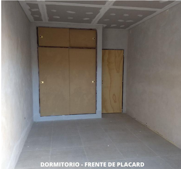
DORMITORIO - FRENTE DE PLACARD

A continuación, adjuntamos algunas fotos que demuestran el grado de avance de las tareas realizadas hasta el momento.