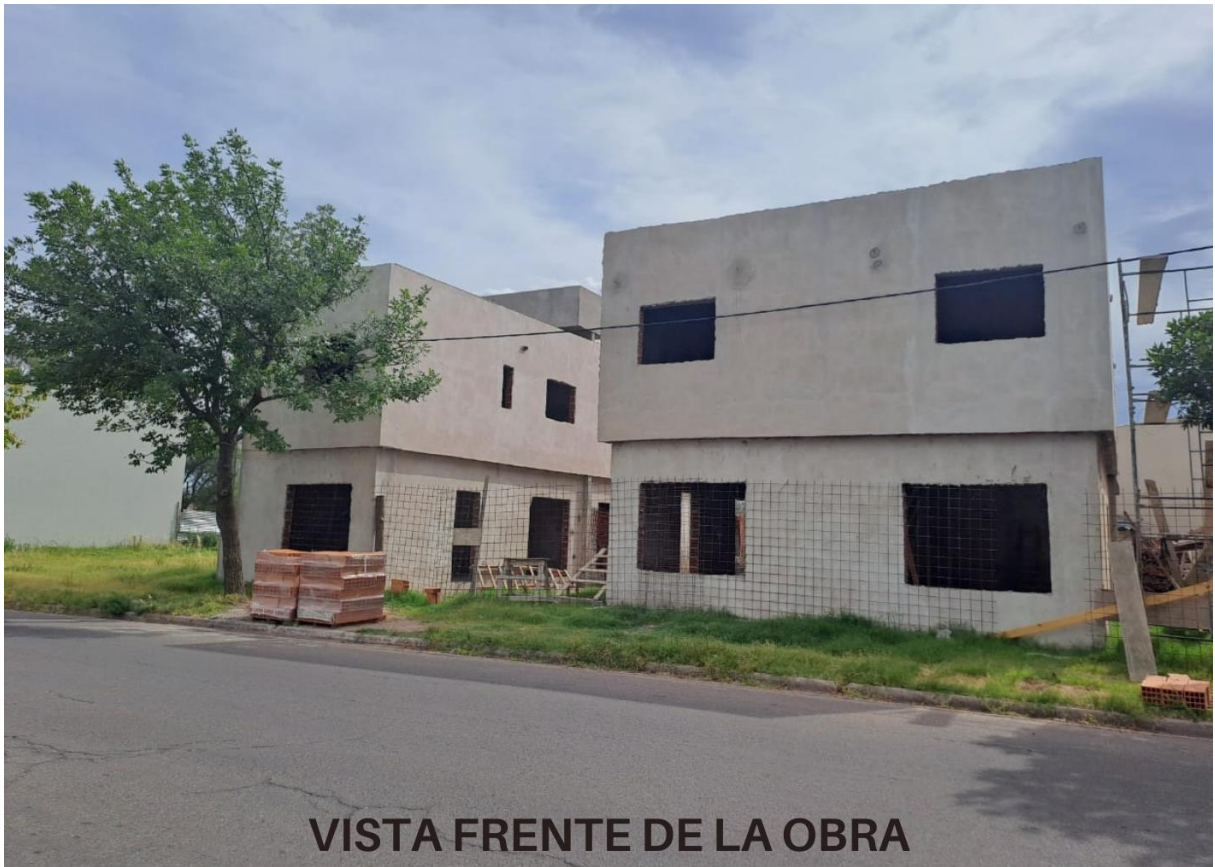
VISTA FRENTE DE LA OBRA