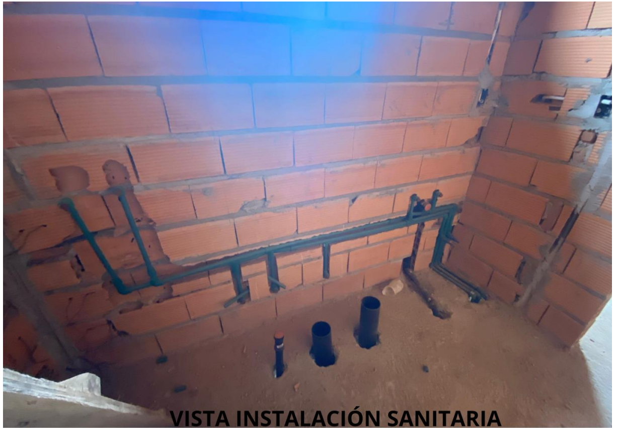
VISTA INSTALACIÓN SANITARIA