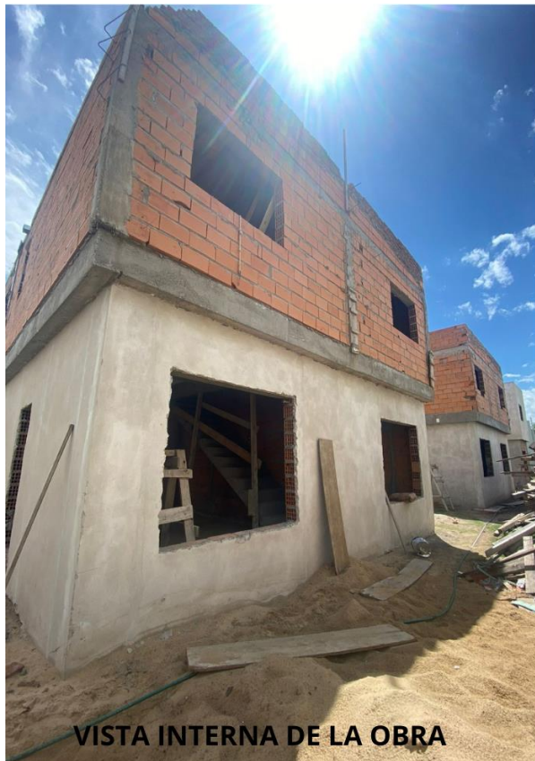
VISTA INTERNA DE LA OBRA