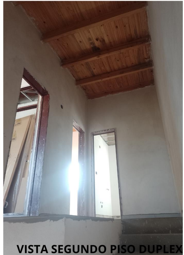
VISTA SEGUNDO PISO DUPLEX