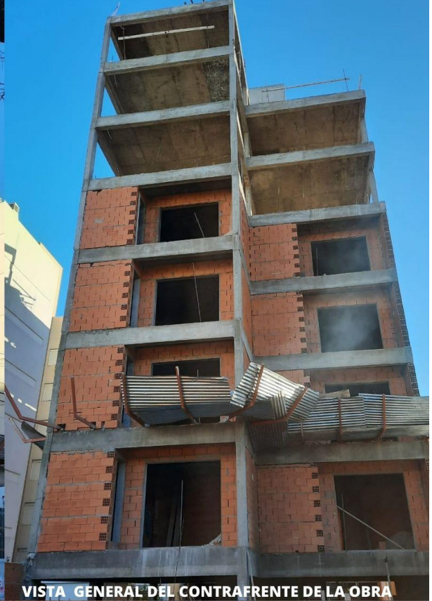
VISTA GENERAL DEL CONTRAFRENTE DE LA OBRA