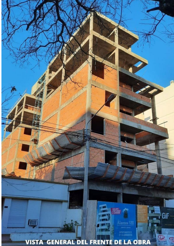
VISTA GENERAL DEL FRENTE DE LA OBRA

A continuación, adjuntamos algunas fotos que demuestran el grado de avance de las tareas realizadas hasta el momento.