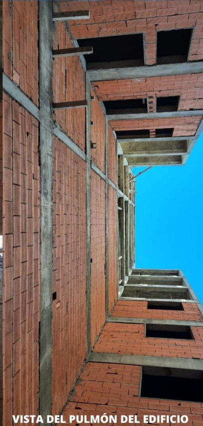
VISTA DEL PULMÓN DEL EDIFICIO