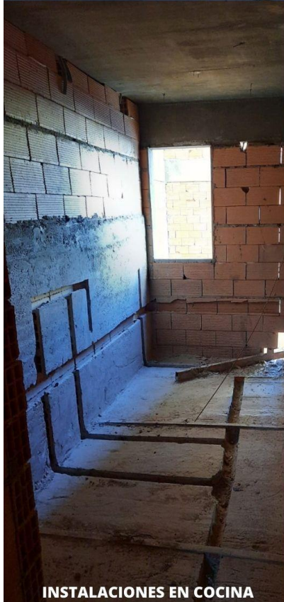
INSTALACIONES EN COCINA